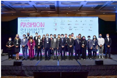
圖四 香港特別行政區政府商務及經濟發展局局長邱騰華先生（左八）及「創意香港」總監曾昭學先生（左六）與一眾嘉賓為「時尚高峰（香港）2021」主持揭幕儀式。