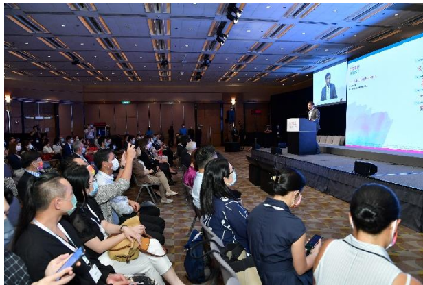
圖十 「時尚高峰（香港）2021」提供了寶貴的平台予業界交流可持續時裝的見解，共計講者逾 40 位，來自本地及世界各地的時裝業領袖、學者及非政府組織代表，以實體及網上同步形式進行多場主題演講及專題討論，與會者及實時網上出席人數合共逾千人。